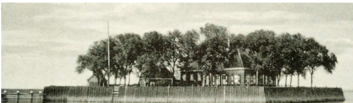
DE ZIEL VAN SCHOKLAND

De leden die zich naar aanleiding van de vooraankondiging in juni al hadden aangemeld ontvangen hierover binnenkort bericht.