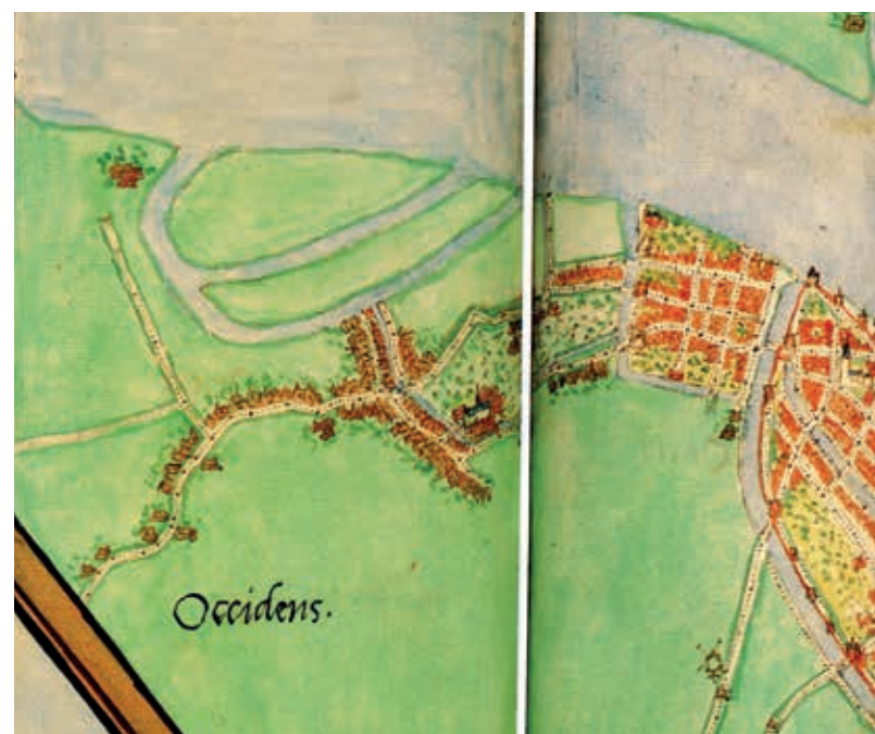
Detail van het netexemplaar van de plattegrond van Jacob van Deventer (ca. 1557-1558) met Brunnepe en de Hagen (Biblioteca Nacional España)

In de Hagen is gegraven op een locatie waar volgens de genoemde kaart door Van Deventer bebouwing aanwezig moet zijn geweest. Op de kaart vertoont het voorstadje een duidelijke stedelijke lay-out. Veel Nederlandse steden werden tijdens de middeleeuwen door brand geheel of gedeeltelijk verwoest. In 1524 moet ook de Hagen door brand grotendeels vernietigd zijn. Aangezien de kaart door Van Deventer bebouwing vertoont, moeten de afgebeelde gebouwen in de periode 1524-1560 tot stand gekomen zijn. Vergelijkbaar met Brunnepe heeft de Hagen in jaren 1572 en 1578 oorlogsschade geleden en is het voorstadje in 1672 volkomen verwoest. Er bestond dan ook geen hoge verwachting om veel van de middeleeuwse bebouwing terug te vinden.